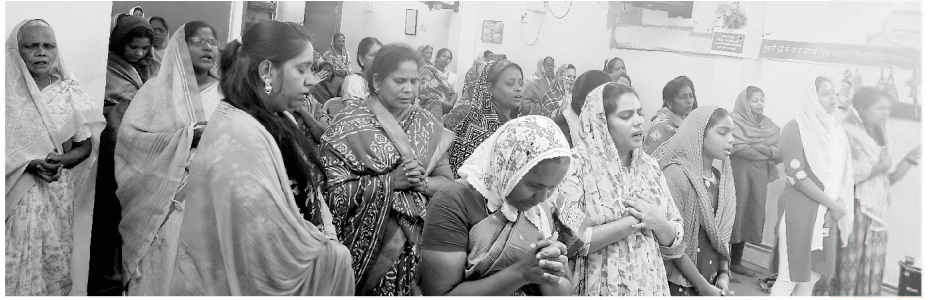
महिलाओं के लिए विशेष कैम्प

जी हां, परमेश्वर यीशु मसीह के अनुग्रह से हम सुरक्षित हैं। परमेश्वर ने अपनी सामर्थ से हमारे सहकर्मियों को छूआ है और उन्हें विभिन्न रोगों और मानसिक पीड़ाओं से चंगाई दी है।