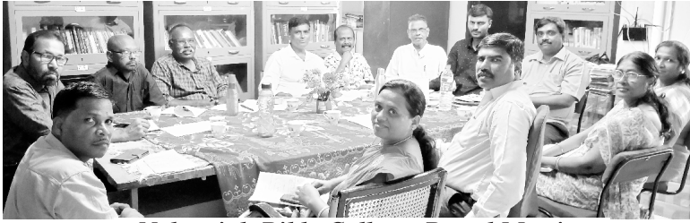
Nehemiah Bible College Board Meeting

परिवार पर और आपके देश पर कृपा बनाए रखने की प्रार्थना करते हैं।