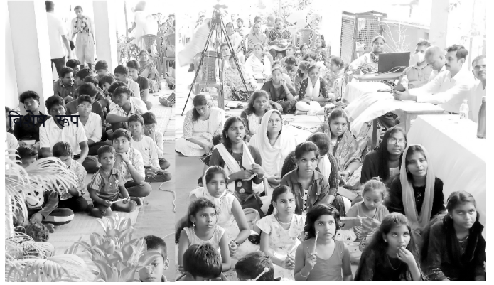
Prayer for students appearing Public Examination

हम दुनिया के सभी देशों में शांति और समृद्धि के लिए लगातार प्रार्थना करते हैं। से, हम भारत की आत्मिक समृद्धि के लिए प्रार्थना करते हैं। हम परमेश्वर से आप पर, आपके