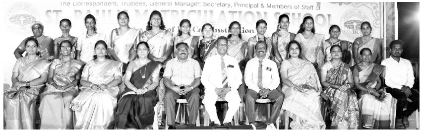
Annual Day of St. Paul's Matriculation School

हमें अपने सेंट पहल मैट्रिकुलेशन स्कूल में 2 मार्च, 2024 को आयोजित वार्षिक दिवस समारोह की सफलता की रिपोर्ट प्रस्तुत करते हुए खुशी हो रही है। छात्रों ने कार्यक्रम के दौरान अपनी प्रतिभा का प्रदर्शन किया, और इसमें कई माता-पिता, बच्चों और आसपास के क्षेत्र के निवासियों ने भाग लिया। यह एक सम्मेलन और मुक्ति सभा जैसा था, और हम आपकी निरंतर प्रार्थनाओं के लिए धन्यवाद देते हैं।