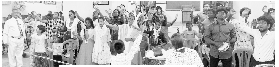
Children and Youth Rally

हम कलीसिया की आराधना के बाद हर रविवार को नियमित रूप से छोटे बच्चों से मिलते हैं। इन बच्चों का परमेश्वर के मार्गों में बढ़ाया जाता है। हमें अपने सेंट पौल्स मैट्रिकुलेशन स्कूल और नहेमायाह बाइबल कॉलेजों के लिए हिंदी और तमिल भाषाओं में अधिक छात्रों, अच्छे शिक्षकों और अगुवों की आवश्यकता है। इसके अतिरिक्त, हमें सभी 96 भाषाओं में मासिक समाचार पत्र, एको ऑफ़ हिज़ कॉल के लिए अधिक पाठकों की आवश्यकता है। कृपया हमें अपने मित्रों और रिश्तेदारों