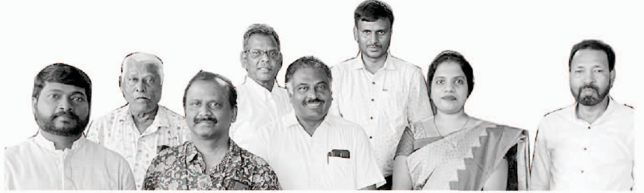
নহিমিয়া বাইবেল কলেজ চলাওতাসকল

তেওঁৰ আহ্বানৰ প্ৰতিধ্বনিৰ পৰিচৰ্যাসমূহৰ বাবে আপোনালোকে কৰা প্ৰাৰ্থনা আৰু সহায়ৰ বাবে আপোনালোকক গভীৰভাৱে ধন্যবাদ জনাইছো। এই সম্পৰ্কত আমাৰ নহিমিয়া বাইবেল কলেজৰ বিষয়ে আপোনাক মনত পেলাই দিব বিচাৰো, য'ত বৰ্তমান তামিল আৰু হিন্দী ভাষাত ক্লাচসমূহ লোৱা হৈ আছে। আমি নৱবৰ্ষত প্ৰবেশ কৰাৰ লগে লগে আমি কলেজখনক বিস্তাৰ কৰিবলৈ ইংৰাজীকো অন্তৰ্ভুক্ত কৰিবলৈ পৰিকল্পনা কৰিছো। আমি এটা বিষয় ঘোষণা কৰিবলৈ পাই আনন্দিত হৈছো যে সন্মানিত স্বীকৃতি সংস্থা - এচিয়া থিয়ল'জিকেল সংস্থাৰ পৰা আমি স্বীকৃতি পোৱাৰ চূড়ান্ত পৰ্যায়ত আছো। তেওঁলোকৰ পৰা স্বীকৃতি পাব