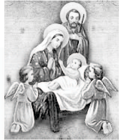
আমাৰ বাবে এটি শিশু জন্মিল!

যীচু খ্ৰীষ্টৰ জন্মই আমাক মনত পেলাই দিয়ে যে ঈশ্বৰে তেওঁৰ প্ৰতিশ্ৰুতিক পৰিপূৰ্ণ কৰে। তেওঁ যি কয় তাক পৰিপূৰ্ণ কৰিবই। তেওঁ কেতিয়াও মিছা নকয় বা কেতিয়াও মন সলনি নকৰে। কেতিয়াবা আনকি অলপ পলম হ'ব পাৰে বা কেতিয়াবা অলপ বংশৰো পাৰ হ'ব পাৰে কিন্তু তেওঁৰ প্ৰতিশ্ৰুতি সদায় পূৰ্ণ হ'ব। বাইবেলে কয়, আকাশ আৰু পৃথিৱী লুপ্ত হ'ব, কিন্তু মোৰ বাক্য হ'লে লুপ্ত নহ'ব। মথি ২৪:৩৫। আমি প্ৰায়