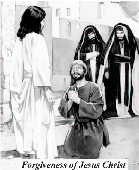
Forgiveness of Jesus Christ

অৱশেষত যেতিয়া ঈশ্বৰে এই পৃথিৱীক সৃষ্টিকৰিলে, তেওঁ দেখিলে যে এইটো উত্তম, সুন্দৰ আৰু সিদ্ধ আছিল। কিন্তু, অবাধ্যতাৰ যোগেদি পাপৰ প্ৰৱেশ হ'ল আৰু সকলো পৰিৱৰ্তন হ'ল। ইয়াৰ দ্বাৰাই পাপ হ'ল আৰু মানৱজাতিয়ে পাপৰ পৰা উদ্ধাৰ পাবলৈ চেষ্টা কৰি আছে ইয়াৰ পৰিণামো ভুগি আছে। এনে মতামত প্ৰত্যেক ধৰ্মতে আছে। বাইবেলে কয় যে, ... পাপৰ বেচ মৃত্যু ... ৰোমীয়া ৬:২৩। আন বাক্যত ক'লে, আমাৰ পাপময় ব্যৱহাৰবোৰে কেৱল আমাৰ শাৰীৰিক মৃত্যুতে সীমিত হৈ থকা নাই কিন্তু আত্মিক মৃত্যুতো আছে। পাপে আমাক ঈশ্বৰৰ পৰা পৃথক কৰি দিছে, আমাৰ মাজত এটা ডাঙৰ শূণ্য সৃষ্টি কৰিছে। কিন্তু যীচুৰ জন্মই এই দুৰত্বৰ আগত শেষ আঁচ টানি দিছে। যেতিয়া যীচু এই জগতলৈ আহিছিল তেওঁৰ উদ্দেশ্য আছিল যে আমাৰ শাস্তিৰ স্থান তেওঁ ল'ব আৰু আমাৰ পাপৰ বাবে তেওঁ প্ৰাণ দিব। ত্ৰুচত মৃত্যু হোৱাৰ দ্বাৰাই যীচুৱে আমালৈ এটা বিশেষ “অনুগ্ৰহ” উপহাৰস্বৰূপে দান দিলে। বৰদিনে ঈশ্বৰৰ নিকা, স্বাৰ্থহীন প্ৰেম যি অনুগ্ৰহৰ ৰূপত আছে, তাকে সোঁৱৰণ কৰায়। তাৰোপৰি, ৰোমীয়া ৮:৩৪ পদত উল্লেখ কৰে যে যীচুৱে একেৰাহে আমাৰ হৈ মধ্যস্থতা কৰি আছে। এইটো গুৰুত্বপূৰ্ণ বিষয় যে কোনো পাপ ইমান ডাঙৰ নহয় যে তাক অনুগ্ৰহে ঢাকিব নোৱাৰে।