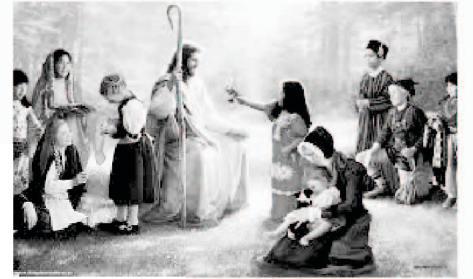
যুৱক-যুৱতী আৰু শিশুসকলৰ সৈতে প্ৰভু যীচু খ্ৰীষ্ট

আমাৰ নিবেদিত সহকৰ্মীসকলৰ বহুতে যিবিলাকে আমাৰ পৰিচৰ্যাৰ সন্মুখভাগত পৰিচৰ্যা কৰি আছে, তেওঁলোকে বিভিন্ন ৰোগৰ সৈতে সংগ্ৰাম কৰি আছে আৰু ক্ষতিৰ সন্মুখীন হৈছে। আমাৰ সকলো দাসসকলৰ পৰিয়ালৰ পৰিস্থিতি, মঙ্গল আৰু নিৰাপত্তাৰ বাবে প্ৰাৰ্থনা কৰিবলৈ আমি নশ্বৰে আপোনালোকক অনুৰোধ জনাইছো। এই বছৰৰ আমাৰ নৱবৰ্ষৰ কাৰ্যসূচীটো ৩১ ডিচেম্বৰ নিশা ১০ টা বজাত আমাৰ ইউ টিউব চেনেলত সম্প্ৰচাৰ কৰা হ'ব। আপোনাৰ সুবিধামতে এই কাৰ্যসূচীক চাবলৈ আপোনাক আদৰণী জনাইছো।