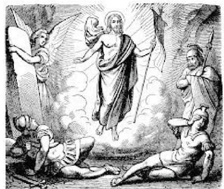
ଦ୍ଵାରରେ ରହିଥିବା ପ୍ରସ୍ତରକୁ ଘୁଞ୍ଚାଇ ଦେଇଥିଲେ ଓ ଏହା ଉପରେ ବସିଥିଲେ (ମାଥୁଉ ୨୮:୨) ।

ପ୍ରିୟ ଭାଇ ଓ ଭଉଣୀ, ଆପଣଙ୍କ ଜୀବନରେ ଗୋଟିଏ ପ୍ରସ୍ତର - ଗୋଟିଏ ପ୍ରତିବନ୍ଧକ ଥାଇପାରେ ଯାହାକୁ ଗଢ଼ାଇ ଦିଆଯାଇ ପାରି ନାହିଁ । ବେଳେବେଳେ, ଏହାକୁ ଆପଣ କିମ୍ବା କୌଣସି ଶକ୍ତିଶାଳୀ କିମ୍ବା ଧନୀ ବ୍ୟକ୍ତି ଘୁଞ୍ଚାଇ ପାରନ୍ତି ନାହିଁ । ମାତ୍ର ଭଲ କରନ୍ତୁ ନାହିଁ, ଯେଉଁଠାରେ କୌଣସି ମାର୍ଗ ନ ଥିବ, ସେହିଠାରେ ଇଶ୍ଵର ଏକ ମାର୍ଗ ପ୍ରସ୍ତୁତ କରିବେ । ଏହା ହୁଏତ ବେଶୀ ଦୂର ହୋଇ ନ ଥାଏ । ଇଶ୍ଵର ଆପଣଙ୍କୁ ଜଗିବା ପାଇଁ ଦୂତମାନଙ୍କୁ ଦାୟିତ୍ଵ ଦେବେ । ଦୂତମାନେ ଆପଣଙ୍କ ପାଇଁ କାର୍ଯ୍ୟ କରୁଛନ୍ତି । ସେମାନେ ସେହି ପ୍ରସ୍ତରଗୁଡ଼ିକୁ ଘୁଞ୍ଚାଇ ଦେବେ ଯେଉଁଗୁଡ଼ିକ ଆପଣଙ୍କ ଆଶୀର୍ବାଦରେ ବାଧା ଦେଉଛନ୍ତି । ଏହାପରେ ସେମାନେ ଆପଣଙ୍କୁ ପ୍ରଭୁଙ୍କ ଆଶୀର୍ବାଦଗୁଡ଼ିକୁ ଉପଭୋଗ କରିବା ପାଇଁ ସୁଯୋଗ ଦେବେ ଓ ସେମାନେ ପ୍ରସ୍ତର ଗୁଡ଼ିକ ଉପରେ ବସି ରହିବେ । ଆପଣ ଇଶ୍ଵରଙ୍କ ଆଶୀର୍ବାଦର ଶସ୍ୟଖଳା ଉପରେ ଅଛନ୍ତି । ଦୃଢ଼ ରହନ୍ତୁ । ଆପଣଙ୍କ ଦୁଃଖ ଅତିଶୀଘ୍ର ଆନନ୍ଦରେ ପରିଣତ ହେବ ।