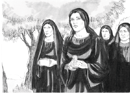
ସେଠାରେ ଏକ ବଡ଼ ଭୂମିକମ୍ପ ହୋଇଥିଲା, କାରଣ ପ୍ରଭୁଙ୍କର ଜଣେ ଦୂତ ସ୍ଵର୍ଗରୁ ଅବତରଣ କରି ସମାଧିରୁ

ସାତ ଭୂତ ଦ୍ଵାରା ଆକ୍ରାନ୍ତ ହୋଇଥିବା ମରଦଲିନୀ ମରିୟନ ଯୀଶୁଙ୍କ ଦ୍ଵାରା ଉଦ୍ଧାର ପାଇଥିଲେ । ସେ ଅନ୍ୟ ଜଣେ ମରିୟନଙ୍କ ସହିତ ମିଶି ଯୀଶୁଙ୍କ ଶରୀରକୁ ରକ୍ଷାଯାଇଥିବା ସମାଧି ନିକଟକୁ ଯାଇଥିଲେ ।