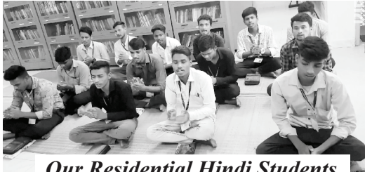
Our Residential Hindi Students

ଆପଣମାନେ ଈଶ୍ଵରଙ୍କ ଅନୁଗ୍ରହକୁ ଲୁଚାଇରେ ଥିବେ ବୋଲି ଆମେ ଆଶା କରୁଛୁ । ଆମେ ଆପଣମାନଙ୍କୁ ଆମର ନିରବଚ୍ଛିନ୍ନ ପ୍ରାର୍ଥନା ଓ ନିବେଦନରେ ଚୋଳି ଧରୁଅଛୁ । ଈଶ୍ଵର ନିଶ୍ଚୟ ଆଗାମୀ ଦିନରେ ଆପଣମାନଙ୍କ ଜୀବନରେ ମହତ୍ଵ କାର୍ଯ୍ୟ ସାଧନ କରିବେ । ଆଜି ହିଁ ଏକ ଆଶ୍ଚର୍ଯ୍ୟକର୍ମ ପାଇଁ ତାଙ୍କୁ ବିଶ୍ଵାସ କରନ୍ତୁ ।