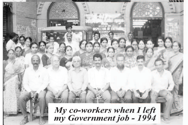
My co-workers when I left my Government job - 1994