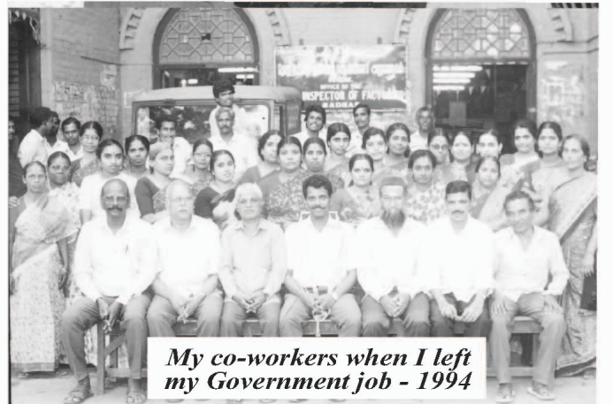
My co-workers when I left my Government job - 1994