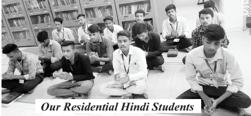
Our Residential Hindi Students

దేవుని కృపచేత మీరు చక్కగా ఉన్నారని మేము నిర్లక్షించుచున్నాము. మేము మిమ్ములను నిరంతరము మా ప్రార్థన మరియు విజ్ఞాపన ద్వారా ఎత్తిపట్టుకొనుచున్నాము. రాబోవు దినములలో దేవుడు మీ జీవితములలో గొప్ప కార్యములను చేస్తాడు. ఆశ్చర్యకార్యమును చేయునట్లు నేడే విశ్వసించుము!