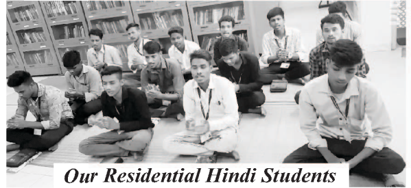
Our Residential Hindi Students

ප්‍රේමණීය මිත්‍රයෙහි, අපගේ ස්වාමිවූ විශ්වයේ ගැලවුම්කාර ශේෂස්ත්‍රීය ස්වභාවයේ ඔබවත් නාමයෙන් ඔබට සුභ පැතුම් ගෙනෙමි.