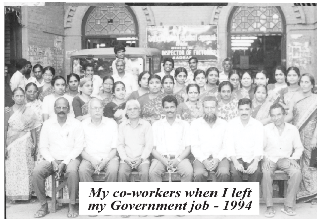
My co-workers when I left my Government job - 1994