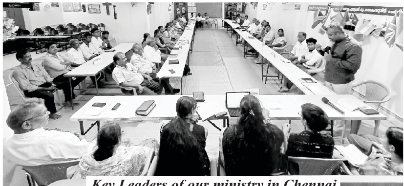
Key Leaders of our ministry in Chennai

ਜਦੋਂ ਪ੍ਰਾਰਥਨਾ ਅਸਫਲ ਹੋ ਜਾਂਦੀ ਹੈ, ਪਵਿੱਤਰਤਾ ਅਸਫਲ ਹੋ ਜਾਂਦੀ ਹੈ। ਹਰ ਕਿਸਮ ਦੇ ਪਾਪ ਅੰਦਰ ਆਉਂਦੇ ਹਨ - ਅੱਖਾਂ ਦੀ ਲਾਲਸਾ, ਸਰੀਰ ਦੀ ਲਾਲਸਾ ਅਤੇ ਜੀਵਿਕਾ ਦਾ ਘਮੰਡ ਆਉਂਦੇ ਹਨ ਅਤੇ ਨਿੱਜੀ ਮੁਕਤੀ ਅਤੇ ਵੱਡੇ ਪੱਧਰ 'ਤੇ ਮਸੀਹ ਦੇ ਸਰੀਰ ਲਈ ਤਬਾਹੀ ਦਾ ਕਾਰਨ ਬਣਦੇ ਹਨ। ਕੋਈ