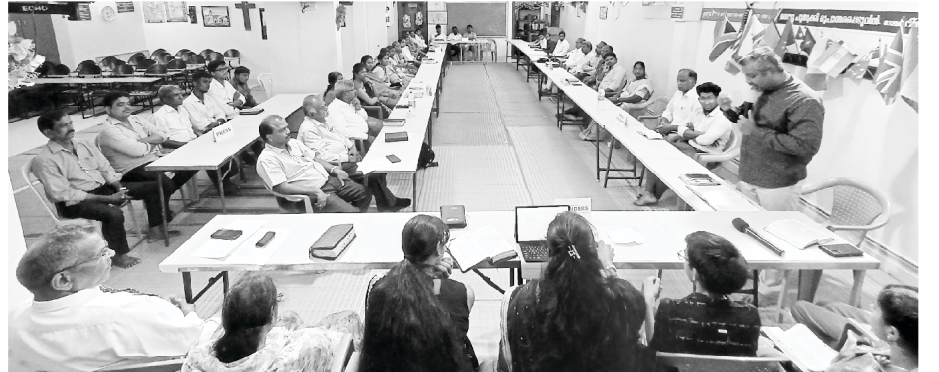
ચૈન્નાઈમાંના અમારી મિનિસ્ટ્રીના ચાવીરૂપ આગેવાનો

Our Ministries: ❖ ECHO OF HIS CALL Monthly Magazines (16 languages) ❖ BIBLECOR - Postal Courses (3 languages) ❖ Online Courses ❖ Theological Correspondence Courses (2 languages) ❖ Church Planting ❖ Nehemiah Bible Colleges ❖ Gospel Printing Press ❖ Great Commission Partners ❖ St. Paul's Matriculation School ❖ Crusades ❖ Community Development