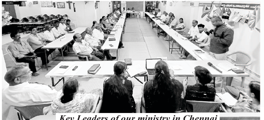
Key Leaders of our ministry in Chennai

تھکرا اور نوک جھوک دعا کی عدم موجودگی کی وجہ سے ہے۔ بے دعا دو چیزوں میں سے کسی ایک کا ذریعہ ہے، یعنی تھکرا یا بچھے ہٹنا۔ بولس نے ان لکاروں اور پریشانیوں کو واضح طور پر جانتے ہوئے جو رفاقت میں پیدا ہوں گی، کلیسیا کے لیے ایک سخت قانون بنایا کہ مردوں کو بلا ناغہ کے دعا کرنی چاہیے۔ تم تو تھکے ہو اس مسئلے کو سنہالنے کی ذمہ داری دی گئی تھی۔ جب رسول ابتدائی کلیسیا میں دعا کے لیے کم وقت کے ساتھ چیزوں کو سنہال رہے تھے، تو انہوں نے پریشانی، عدم اطمینان اور جھگڑے کو پکے دیکھا۔ انہوں نے فوری طور پر وجہ کی تشخیص کی: دعا کی غیر موجودگی۔ جب انہوں نے دعا کے لیے ضروری انتظامات کیے تو پھر رفاقت کی مٹھاس جاری رہی (اعمال ۶: ۴)۔