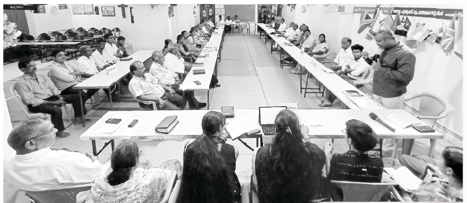
Key Leaders of our ministry in Chennai

Our Ministries: ECHO OF HIS CALL Monthly Magazines (16 languages) BIBLECOR - Postal Courses (3 languages) Online Courses Theological Correspondence Courses (2 languages) Church Planting Nehemiah Bible Colleges Gospel Printing Press Great Commission Partners St. Paul's Matriculation School Crusades Community Development