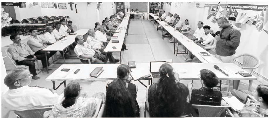
ചെന്നൈയിലെ നമ്മുടെ ശുശ്രൂഷയുടെ മുഖ്യ നേതാക്കൾ

പിറുപിറുപ്പും വഴക്കുമാക്കെ ഉണ്ടാകുന്നത് പ്രാർത്ഥനയുടെ അഭാവം മൂലമാണ്. പ്രാർത്ഥനയില്ലാത്ത വ്യക്തി പിണക്കത്തിന്റെയോ പിന്മാറ്റത്തിന്റെയോ അനുഭവമുള്ളവരാണ്. കൂട്ടായ്മയിൽ ഉണ്ടാകുന്ന വെല്ലുവിളികളും പ്രശ്നങ്ങളും വ്യക്തമായി മനസ്സിലാക്കിയ പൗലോസ്, എല്ലാവരും ഇടവിടാതെ പ്രാർത്ഥിക്കണമെന്ന് സഭയിൽ കർശനമായ നിയമം പ്രഖ്യാപിച്ചു. ഈ പ്രശ്നം കൈകാര്യം ചെയ്യാനുള്ള ചുമതല തിമൊഥെയോസിനായിരുന്നു. ആദിമ സഭയിൽ അപ്പൊസ്തലന്മാർ ഈ പ്രശ്നങ്ങൾ കൈകാര്യം ചെയ്തുകൊണ്ടിരുന്ന