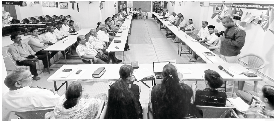
சென்னையில் உள்ள நமது ஊழியங்களின் முக்கிய ஊழியர்களின் கூடுதல்

மக்களோடு உள்ள ஐக்கியம் சிலவேளைகளில் கசப்பான காரியங்களைக் கொண்டு வரும். நாம் பூரண புருஷர்கள் அல்ல. ஆனால் நிறைவுள்ளவர்களாக அனுதினமும் உருமாற்றப்படும் மக்கள். நாம் பரிசுத்த ஆவியானவருக்கு நம்மை திறந்து கொடுத்தால் தேவன் நம்மை சுத்திகரிக்கவும், நம்மை மாற்றவும் மக்களை உபயோகப்படுத்துகிறார். எல்லா இடங்களிலேயும் எந்நேரமும் ஜெபிக்கிற மக்களுக்கு கோபப்படவும், சந்தேகப்படவும் நேரமிருக்காது. ஜெபமில்லா மனிதனுடைய வாழ்வில் இவ்விரண்டில் ஒன்று நேரிடும்: சண்டை அல்லது பின்மாற்றம். ஐக்கியத்தில் முறைக்கக்கூடிய எல்லா சவால்களையும், பிரச்சினைகளையும் தெளிவாக அறிந்த பவுல், தீமோத்தேயு இருந்த திருச்சபையிலே ஒரு உறுதியான சட்டத்தை உருவாக்குகிறார். புருஷர்கள் எல்லா இடங்களிலேயும் ஜெபம் பண்ண வேண்டும். ஆதி திருச்சபையில் அப்போஸ்தலர்கள் காரியங்களை கையாண்டபோது ஜெபிக்க நேரம் குறைவாயிருந்த போது அவர்கள் குழப்பங்களையும், அதிருப்தியையும், பிரச்சினை முளைப்பதையும் கண்டார்கள். அவர்கள் உடனே ஜெபக்குறைவே இதற்கு காரணம் என்பதை