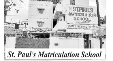
St. Paul's Matriculation School