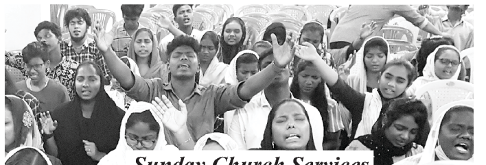
Sunday Church Services