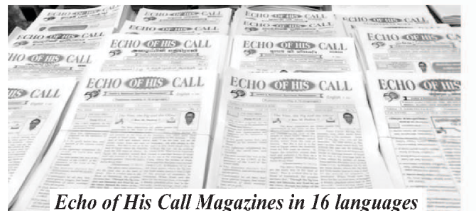
Echo of His Call Magazines in 16 languages