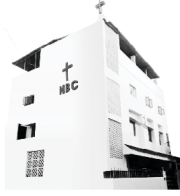
Nehemiah Bible College

આપણે સમકાલીન પેઢીને પ્રાચીન અને પ્રારંભિક પ્રેરિતોનું ઉચ્ચગુણવત્તાવાળું શિક્ષણ સમજાવવું જોઈએ અને શીખવવું જોઈએ. આ સમયની જરૂરિયાત છે.