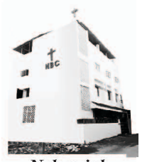
Nehemiah Bible College

گوچ رسالہ کے اشاعت کار - مددگار، اشاعت کار - متبادل مددگاروں کے طور پر