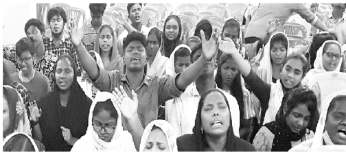
Sunday Church Services

رہنمائی کرتے ہیں، اور اچھے شہریوں کے طور پر انہیں بند