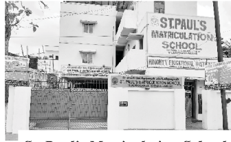
St. Paul's Matriculation School

ہم خدا کا شکریہ کرتے ہیں ہمارے ان ۲۰ عالم کے لئے جو ہمارے ساتھ ۱۶ زبانوں میں (ایکو آف بڑکال میگزین) اس کی بلائٹ کی