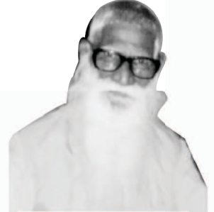
ڈاکٹر این جیو اندم

کر رہا تھا۔ سب سے پہلے، ہم نے (ایکو آف ہز کال) اس کی بلاہٹ کا آغاز کیا۔ شامل اور انگریزی، دو زبانوں کا ماہانہ اخبار، بھر ایک شامل اور انگریزی پندرہ روزہ اخبار اور بھر یہ دو الگ الگ درج کیا ہوا اخبارات یعنی شامل اور انگریزی ماہانہ اخبار بن گئے۔ اب ماہانہ اخبارات شامل، انگریزی، سنہا، ملیالم، افریقی، تیلگو، ہندی، کنڑ، مراٹھی، آسامی، بنگالی،