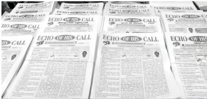
Echo of His Call Magazines in 16 languages