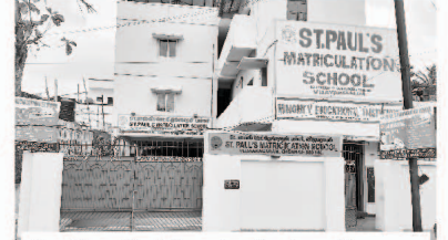
St. Paul's Matriculation School