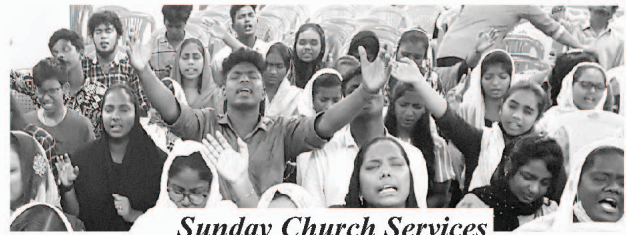
Sunday Church Services