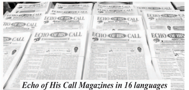
Echo of His Call Magazines in 16 languages

প্রথমে আমি তামিল এবং ইংরাজী, এই দুটি ভাষায় এক সঙ্গে তাঁর আহ্বানের প্রতিধ্বনি মাসিক সংবাদ পত্রিকাটি প্রকাশ করতে শুরু করেছিলাম। তারপর তামিল এবং ইংরাজী ভাষায় পাম্ফ্লেট সংবাদ পত্রিকা প্রকাশ করতে শুরু করেছিলাম। তারপর এটি তামিল এবং ইংরাজী, দুটি পৃথক ভাষায় প্রকাশিত মাসিক পত্রিকা হিসাবে নথিভুক্ত করা হয়েছিল। এখন তামিল, ইংরাজী, সিংহলা, মালয়ালাম, আফ্রিকান, তেলুগু, হিন্দি কানাড়া, মারাঠী, অসমিয়া, বাংলা, উর্দু, নেপালী, গুজরাটী, উড়িয়া, এবং পাঞ্জাবী ভাষায় তাঁর আহ্বানের প্রতিধ্বনি