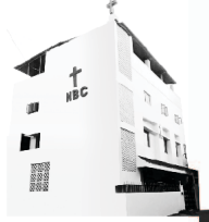
Nehemiah Bible College