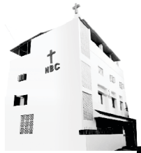
Nehemiah Bible College

জগতলৈ ঈশ্বৰে তেওঁৰ বাক্যক প্ৰচাৰ কৰিবলৈ আমালৈ তেওঁৰ আচৰিত আশীৰ্বাদবোৰক অপৰিত কৰাৰ বাবে তেওঁৰ প্ৰশংসা কৰো।