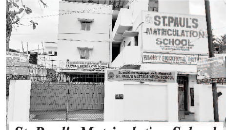
St. Paul's Matriculation School

আমালৈ আপোনালোকে আগবঢ়োৱা আপোনালোকৰ প্ৰেম, যত্ন আৰু সহায়বোৰৰ বাবে ধন্যবাদ জনাওঁ।