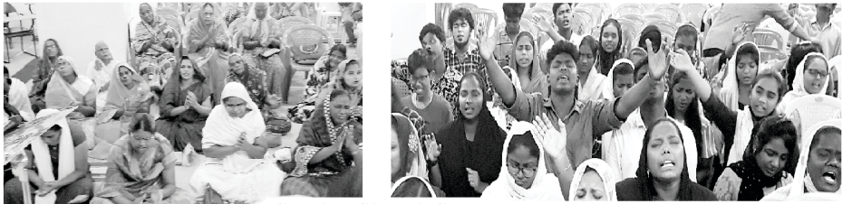
Sunday Church Services

আমাৰ কেন্দ্ৰ মণ্ডলীত থকা আমাৰ কৰ্মীসকলে মিনি বাছেৰে প্ৰত্যেক দেওবাৰে আবেলি বেলাত স্থানীয় মণ্ডলীসমূহত পৰিদৰ্শন কৰে আৰু তাত শিশু পৰিচৰ্যা কৰে আৰু তেওঁলোকক ভাল নাগৰিক হিচাপে গঢ়ি তোলে। ৩১ আগষ্ট, ২০২২ তাৰিখেও গোটেই দিনজোৰা কাৰ্য্যসূচী লোৱা হৈছিল। আমাৰ মণ্ডলীৰ যুৱক-