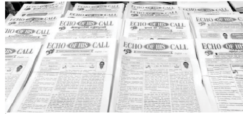
Echo of His Call Magazines in 16 languages

সৰ্বপ্ৰথমে দ্বিভাষীক তামিল আৰু ইংৰাজীত মাহেকীয়া আলোচনী তেওঁৰ আহ্বানৰ প্ৰতিধ্বনি আৰম্ভ কৰিছিলো তাৰ পাছত তামিল