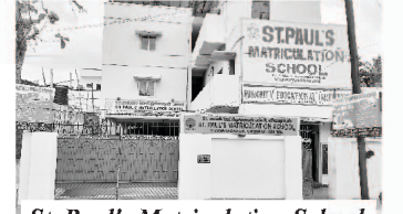
St. Paul's Matriculation School

आमच्या मुख्य मंडळीतील कार्यकर्ते मिनी बस मधून दर रविवारी शाखा मंडळ्यांना भेट देतात आणि लहान