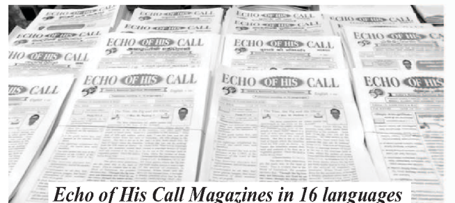
Echo of His Call Magazines in 16 languages

मी मासिकाकरीता इंग्रजी आणि तामिळ भाषेत लेख लिहीत असताना, देव मला माझ्या सहसंपादकांद्वारे, भाषांतरकारां द्वारे आणि स्टाफ द्वारे ती कोणतेही अडखळण न येता प्रसिद्ध करण्यात मदत करित आला आहे.