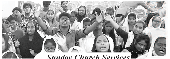
Sunday Church Services

Our Ministries: ❖ ECHO OF HIS CALL Monthly Magazines (16 languages) ❖ BIBLECOR - Postal Courses (3 languages) ❖ Online Courses ❖ Theological Correspondence Courses (2 languages) ❖ Church Planting ❖ Nehemiah Bible Colleges ❖ Gospel Printing Press ❖ Great Commission Partners ❖ St. Paul's Matriculation School ❖ Crusades ❖ Community Development