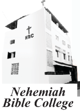
Nehemiah Bible College

आपल्या प्रभु आणि तारणाऱ्या येशू ख्रिस्ताच्या मधुर नामात तुम्हा सर्वांना शुभेच्छा. प्रभुने आम्हाला जगभरात त्याच्या वचनाचा प्रसार करण्याकरिता पुरविलेल्या अब्दूत आशिर्वादाबद्दल त्याची स्तुती करित आहोत. तुमच्या प्रेमाबद्दल, काळजी बद्दल, आणि आधारा बद्दल आम्ही आभार मानित आहोत.