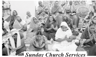
Sunday Church Services

प्रभु में प्रिय भाइयों और बहनों, हमारे प्रभु और उद्धारकर्ता यीशु मसीह के मधुर नाम में आपका अभिवादन। हम परमेश्वर की उन सभी अद्भुत आशीषों के लिए स्तुति करते हैं जो हमें उसके वचन को दुनिया में प्रसारित करने के लिए प्रदान की गई हैं। हमारे प्रति आपके प्रेम, देखभाल और सहायता के लिए हम आपको धन्यवाद देते हैं।