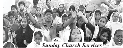
Sunday Church Services

Our Ministries: ✨ ECHO OF HIS CALL Monthly Magazines (16 languages) ✨ BIBLECOR - Postal Courses (3 languages) ✨ Online Courses ✨ Theological Correspondence Courses (2 languages) ✨ Church Planting ✨ Nehemiah Bible Colleges ✨ Gospel Printing Press ✨ Great Commission Partners ✨ St. Paul's Matriculation School ✨ Crusades ✨ Community Development