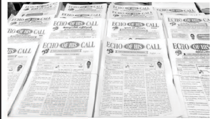
Echo of His Call Magazines in 16 languages