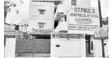
St. Paul's Matriculation School

हमने अपने प्रभु यीशु मसीह के अनुग्रह से अपनी अधिकांश गतिविधियों को फिर से शुरू कर दिया है। हमारे सेंट पौल्स मैट्रिकुलेशन स्कूल में हमारे साथ काम करने, छोटे बच्चों को तैयार करने के लिए शिक्षाविदों का एक अच्छा समूह है। इसी तरह, हमारा नहेमायाह बाइबल कॉलेज १५ प्रख्यात ईश्वरविज्ञानियों के साथ गंभीरता से आगे बढ़ रहा है और युवा पुरुषों और महिलाओं को नियमित और आवासीय के साथ-साथ पत्राचार पाठ्यक्रमों के माध्यम से अगली पीढ़ी तक गौरवशाली सुसमाचार को आगे बढ़ाने के लिए प्रशिक्षण दे रहा है।