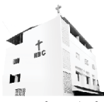
Nehemiah Bible College