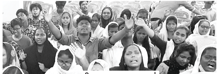
ஞாயிறு சபை ஆராதனைகள்

தமிழ், ஆங்கிலம், தெலுங்கு மற்றும் இந்தி ஆகிய நான்கு மொழிகளிலும் நமது தலைமைச் சபையில், ஒவ்வொரு ஞாயிறு தோறும் காலை 5.30