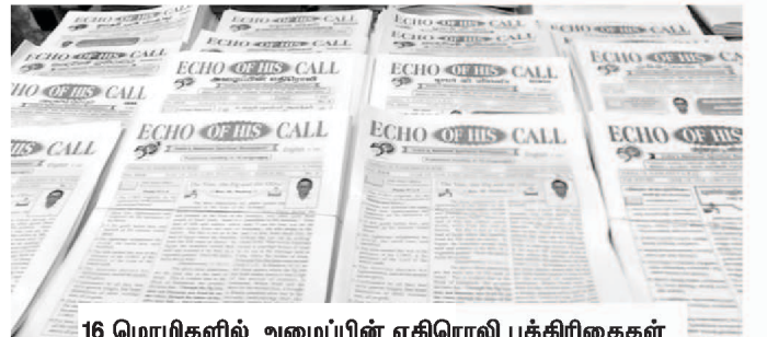
16 மொழிகளில் அழைப்பின் எதிரொலி பத்திரிகைகள்

முதலில் அழைப்பின் எதிரொலி (Echo of His Call) என்ற பெயரில் தமிழ் - ஆங்கில மாதப் பத்திரிகையாகவும், பின்னர் மாதம் இருமுறை தமிழ் - ஆங்கிலப் பத்திரிகையாகவும், அதன் பின்னர் தமிழ், ஆங்கிலம் தனித்தனி பத்திரிகைகளாகவும் பதிவு செய்து பின்னர் ஒவ்வொன்றாக தமிழ், ஆங்கிலம், சிங்களம், மலையாளம், ஆப்கானி, தெலுங்கு, இந்தி, கன்னடம், மராத்தி, அஸ்ஸாமி, வங்காளம், உருது, நேபாளி, குஜராத்தி, ஒடியா, பஞ்சாபி ஆகிய 16 மொழிகளில் தனித்தனி