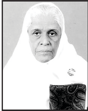
બહેન સારા નવરોજી

તે સમયથી અમારા ઘરમાં આનંદ થઈ રહ્યો. ત્યાં એક સુગંધીદાર સુવાસ હતી, જેણે અમારા ઘરને ભરી દીધી હતી. તે દિવસે, મેં મારા