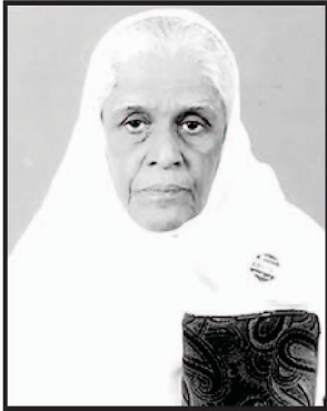
ভনী চাৰা নভাৰজী