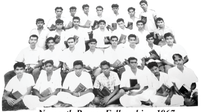
Nazareth Prayer Fellowship - 1967