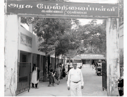
سرکاری سکول کناٹو ولائی