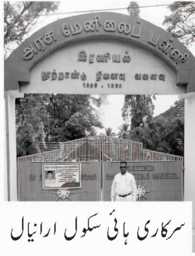
سرکاری ہائی اسکول ارنیال