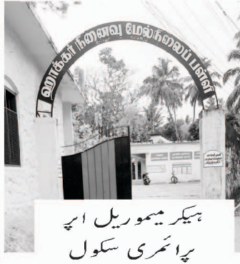
ہیکریموریل اپر پرائمری اسکول