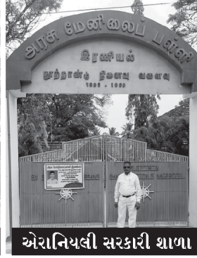
એરાનિયલી સરકારી શાળા