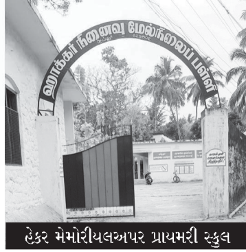
હેકર મેમોરીયલ અપર પ્રાયમરી સ્કૂલ