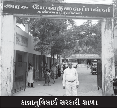
કાન્નાતુવિલાઈ સરકારી શાળા