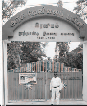
एरानियल सरकारी शाळा