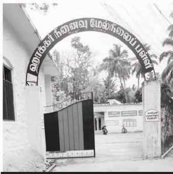
हॅकर मेमोरियल प्राथमरी स्कूल