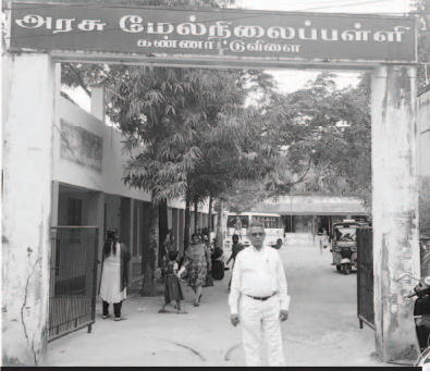
कन्नोटुवीलयी सरकारी शाळा