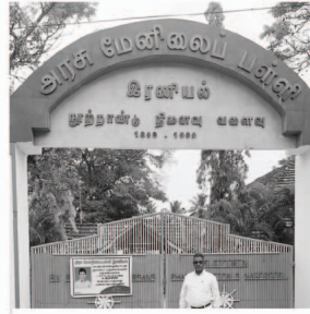
Government High School, Eraniel