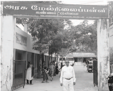
Government School, Kannatuvilai