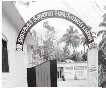
Hacker Memorial Upper Primary School