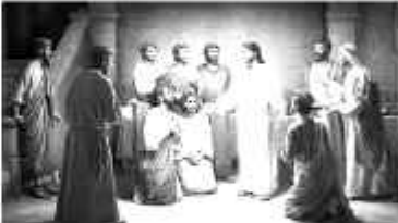
Jesus said 'Peace be with you'

".... යුදෙව්වරුන්ට හැරින් දොරවල් වසා තිබෙද්දී ගෝලයන් එක්වී සිටි තැන්හි සේනසුරාදා දවසේ ඇති මැද සිට නුබලාට සමාදානය වේවා කියා ඔවුන්ට කී සේය." (ගොතාන් 20:19)