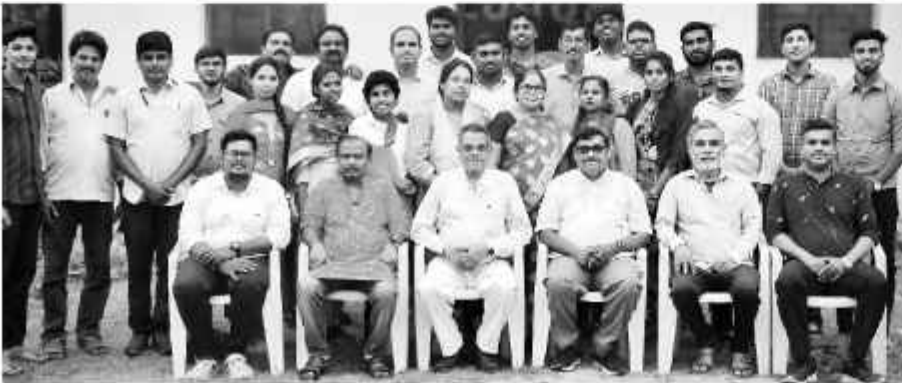
Special retreat of our Nehemiah Bible College students at Mahalapuram

දෙවියන්වහන්සේගේ මගක් කරා ශාන්තවත් කෙරෙහිමයා බයිබල් පිළිගැනෙමින් යේවාචන් ඉතා ගොදුරු ක්‍රියාත්මක වෙයි. උන්වහන්සේ විශ්වාසවන්තව යටිතලකමෙන් මග පෙන්වන නිසා ඉහ උන්වහන්සේට යොමුවන්න වෙමු.