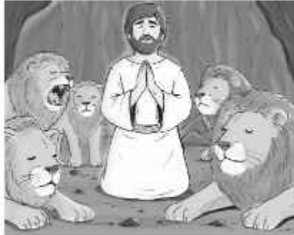
Daniel spent a silent night in the lions' den

උන්වහන්සේ බල රහිත කරන පිණිස ඔබගේ අඳුරු වේලාවේදී උන්වහන්සේ ක්‍රියා කරමින් සිටියි.